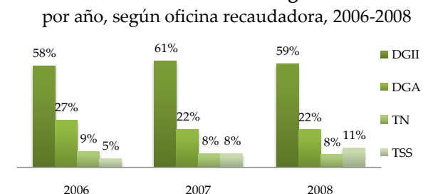
Gráfico 1 Recaudaciones de ingresos